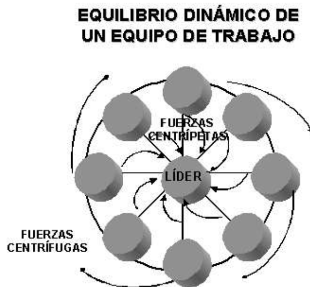
Figura 2: Elaboración del autor en base a los conceptos de Moreno (s.f).

Además el líder debe apoyar al equipo para que logre el equilibrio entre (ver Figura 2 ): 1) las fuerzas centrípetas (motivaciones, intereses y responsabilidades compartidas) que llevan a crear, mantener y aumentar la unión del grupo; y las centrífugas (motivaciones, intereses y labores propias de cada individuo) que tienden a desunir o romper el grupo (Moreno, s.f.). En este sentido, el líder debe generar en el grupo un espíritu de compromiso con su misión y valores, con el cumplimiento del programa acordado y un clima de participación tanto para el análisis de la acción emprendida, como sobre su estado de ánimo y sentimientos.